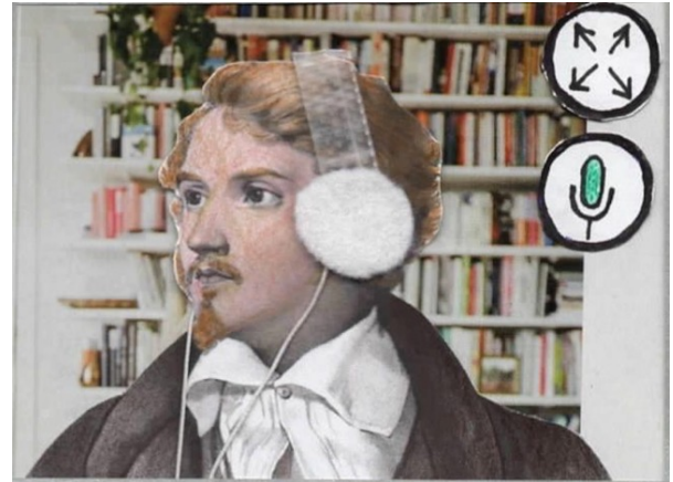
Justus von Liebig heute?